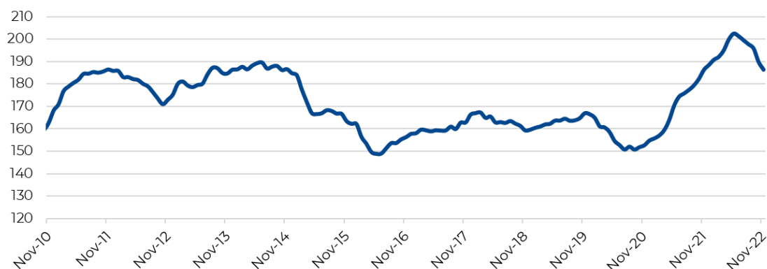
Gráfico 1 – Índice de Precios de Exportación del sector industrial (Base 2004=100)