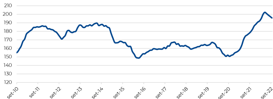
Gráfico 1 – Índice de Precios de Exportación del sector industrial (Base 2004=100)