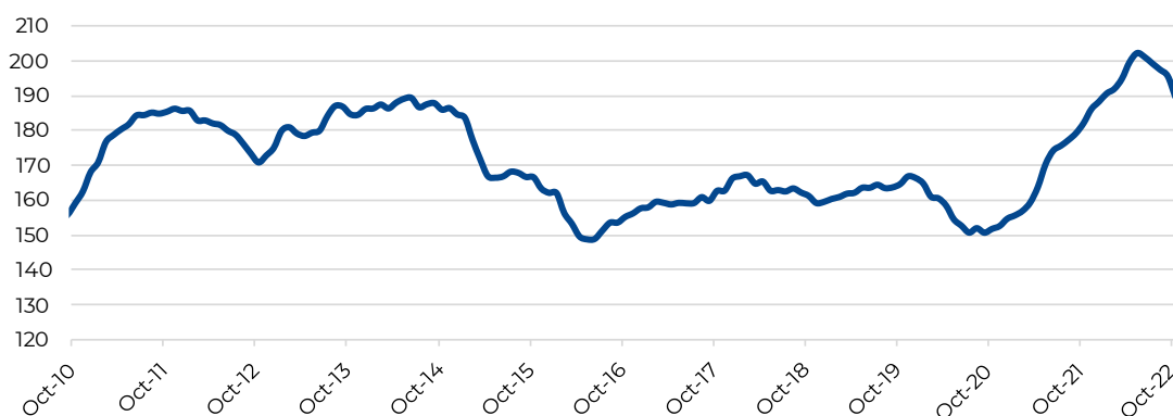
Gráfico 1 – Índice de Precios de Exportación del sector industrial (Base 2004=100)