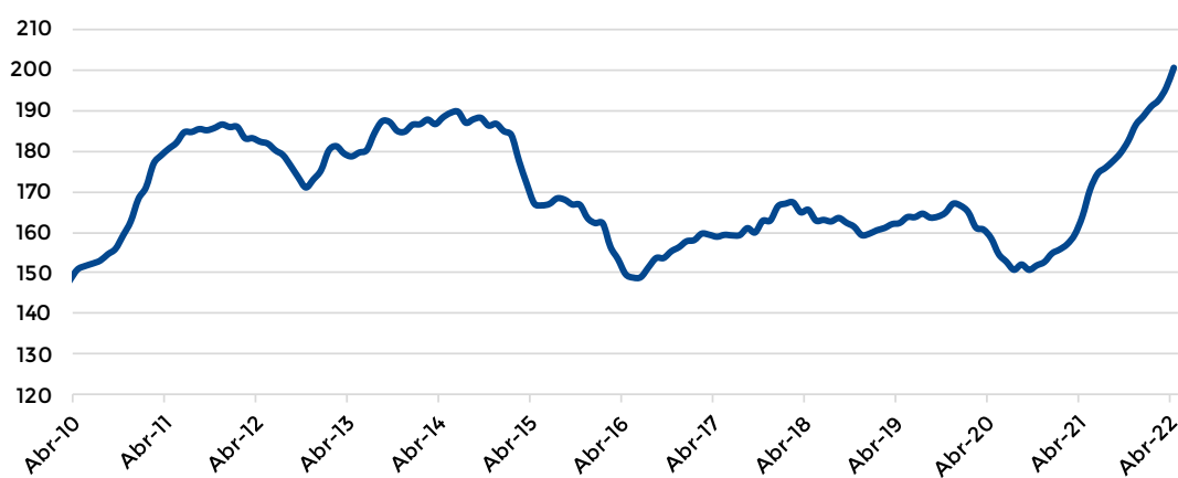
Gráfico 1 - Índice de Precios de Exportación del sector industrial (Base 2004=100)