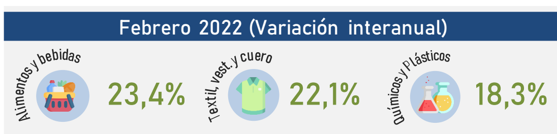
Gráfico 2 – Variación interanual del IPE del sector industrial

La agrupación Químicos y Plásticos mostró un crecimiento del 1,1% en los precios de exportación en febrero con respecto a enero, mientras que en términos interanuales se observó un aumento del 18,3%, explicado por el crecimiento de los precios de las ventas externas de reparaciones químicas anticonceptivas a base de hormonas y recipientes de polietireno.