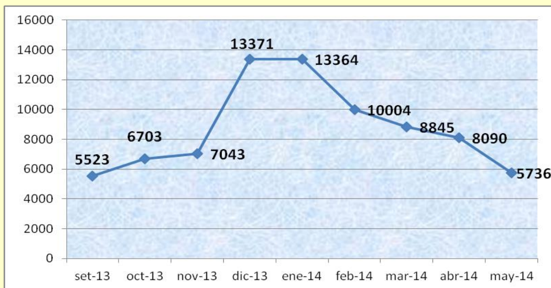
Evolución del total de kilos recolectados por mes sin GG (Valores expresados en kilogramos)