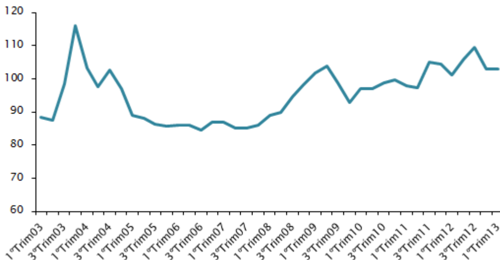
Gráfico 1 - Términos de intercambio de bienes del Uruguay (Serie trimestral, base 2004=100)