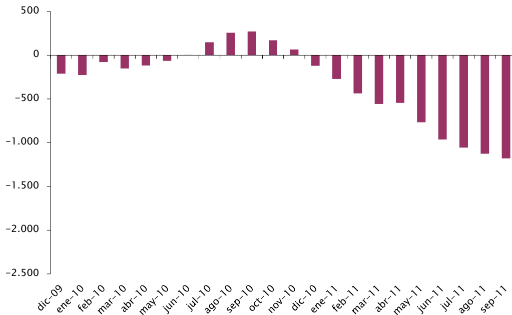
Gráfico 1 – Evolución del saldo de la balanza comercial de bienes (Años móviles, en millones de dólares)