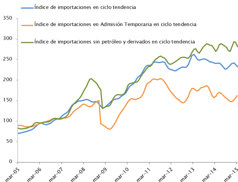
Gráfico 2.1 – Evolución de las importaciones en dólares en ciclo tendencia (Índices base 2006=100, ciclo tendencia)