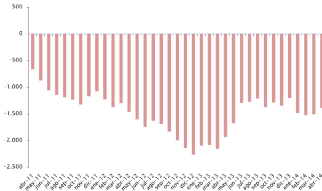
Gráfico 1 – Evolución del saldo de la balanza comercial de bienes (Años móviles, en millones de dólares)