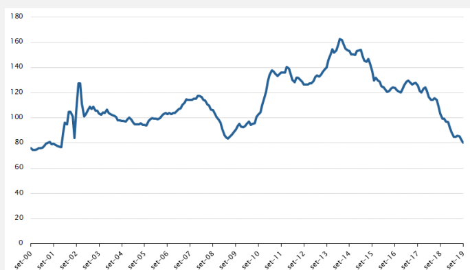
Gráfico - Evolución del Índice de Precios de Exportación de cueros* (Base 2004=100)

En setiembre de 2019, el Índice de Precios de Exportación del sector del cuero registró una caída (-3%) respecto a agosto del 2019, mientras que en la comparación interanual los precios del sector disminuyeron 23%. En este sentido, los precios externos correspondientes al capítulo 41 se encuentran deprimidos en la comparación histórica, registrando niveles muy similares a los evidenciados en la crisis de 2002.