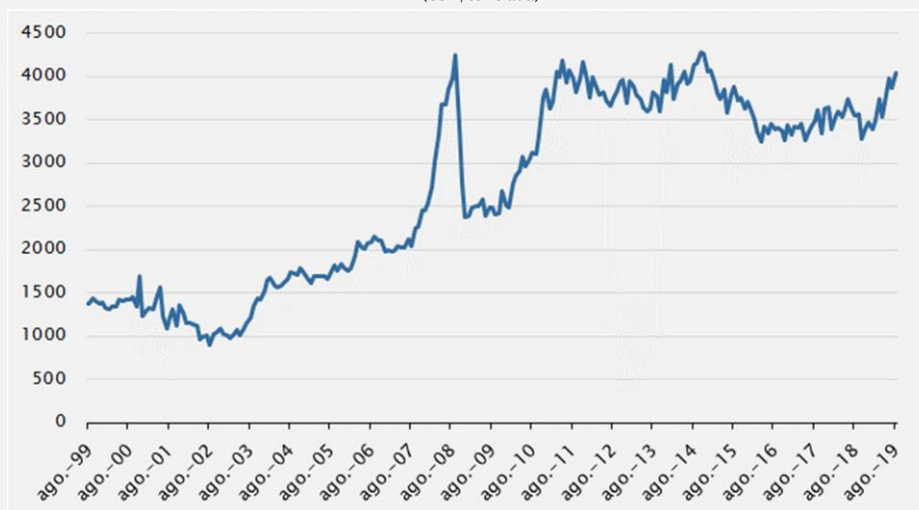
Gráfico - Evolución de los precios de exportación del sector cárnico (USD/tonelada)