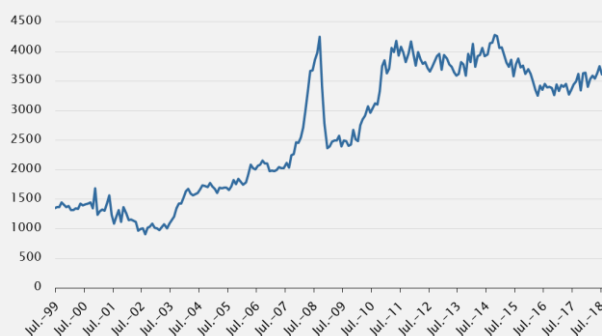
Gráfico - Evolución de los precios de exportación del sector cárnico (US$/tonelada)