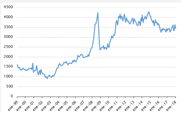
Gráfico - Evolución de los precios de exportación del sector cárnico (US$/tonelada)