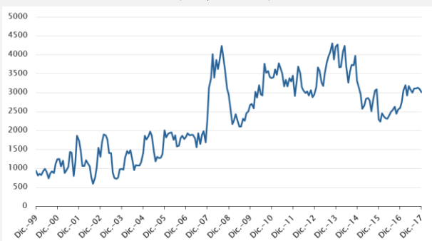
Gráfico – Evolución de los precios de exportación del sector lácteo (US$/tonelada)