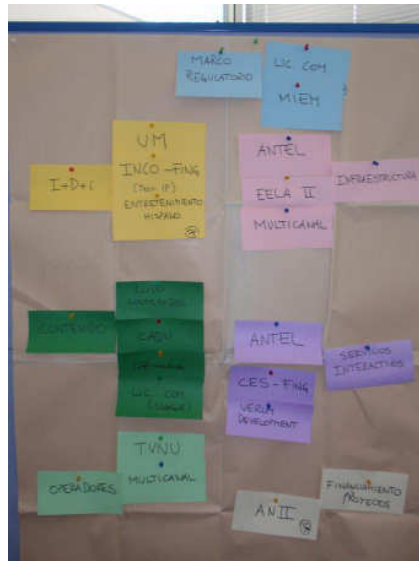
Primera versión de mapa de actores presentes en la reunión

La primera versión del mapa de actores presentes fue la que sigue a continuación: